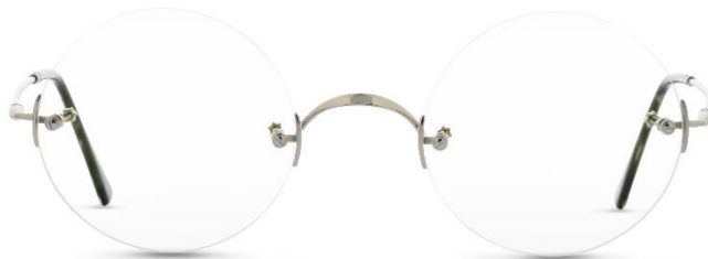
Classic Rund PP UVP: 339,- Euro Material: Metall Farbe: Silber