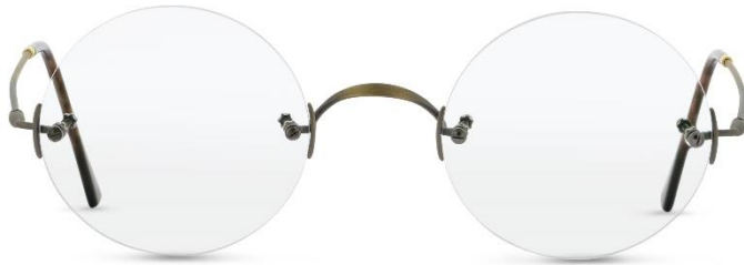
Classic Rund AG UVP: 339,- Euro Material: Metall Farbe: Antik Gold

Die Brillen von Lunor sind bei ausgewählten Fachhändlern weltweit erhältlich.