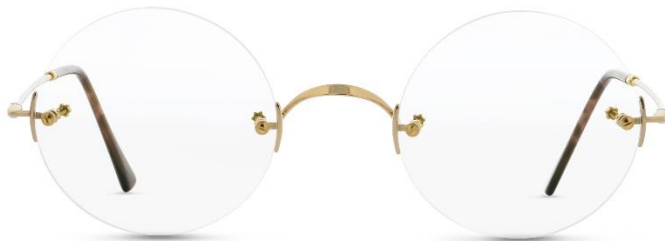
Classic Rund GP UVP: 339,- Euro Material: Metall Farbe: Gold