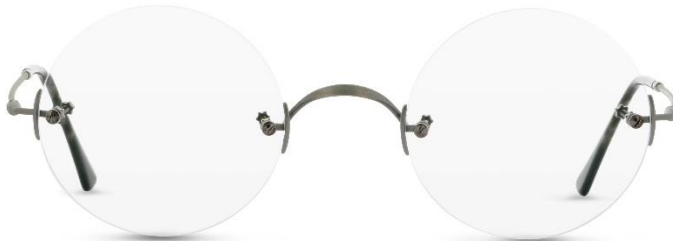
Classic Rund AS UVP: 339,- Euro Material: Metall Farbe: Antik Silber